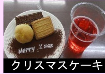
クリスマスケーキ